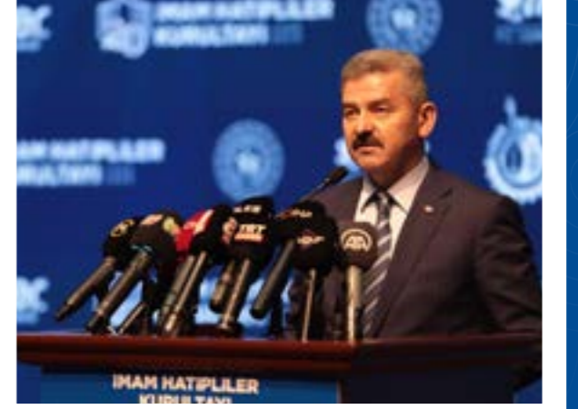
Turan Ergün Uşak Valisi

Çok Kıymetli Başkanım, bugün ise tekstil başta olmak üzere pek çok sanayi kolunda ülkemiz ekonomisine büyük katkılar sağlamaya devam etmektedir. Özellikle geri dönüşüm iplik üretiminde yıllık yaklaşık 411 milyon kilogram ile Türkiye pazarının yüzde 73'üne karşılık gelen bir üretim kapasitesine sahip olan Uşak şeh-