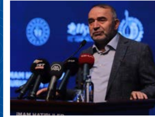
İsrail Kışla Cumhurbaşkanı Başkanışmanı

Rabbim bizleri muvaffak etsin. Ayaklarımızı sabit kılsın. İstikamet üzere yaşamayı bizlere nasip etsin. Diniyle yücelmeyi, dinini yüceltmeyi hepimize nasip etsin diyor, tekrardan ikinci günümüzün ve kapanış günümüzün hayırlı olmasını Rabb'imden niyaz ediyor, nitelikli bir geleceğin bizlerle birlikte geleceğini, sizlerle birlikte geleceğine inanıyoruz. Sağ olun, var olun, Allah'a emanet olun.