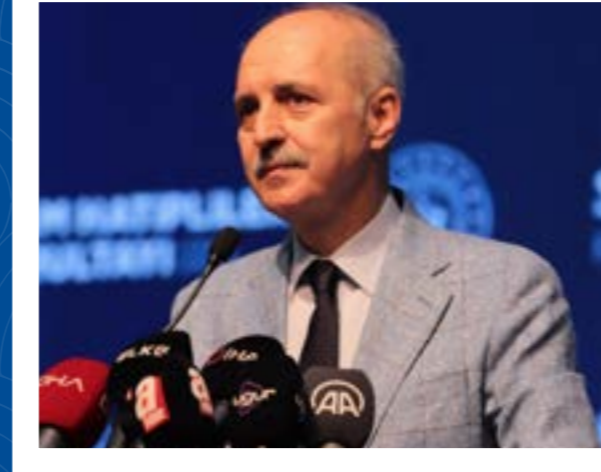
Prof. Dr. Numan Kurtulmuş Türkiye Büyük Millet Meclisi Başkanı

Değerli kardeşlerim, ben de imam hatip davasının içinde yoğrulmuş bir ailenin bir ferdi olarak, küçük yaşlardan itibaren bu meseleyi özümsemiş birisi olarak, gerçekten az evvel burada gösterilen belgeseller çok kısa geçti, oradaki hemen hemen gösterilen bütün simaları geçmişleriyle, birikimleriyle hatırlayan birisi olarak çok kısaca bugün geldiğimiz noktayı çok iyi anlamamız gerektiğini ifade ediyorum ve birkaç hususu sizlerle paylaşmak istiyorum.