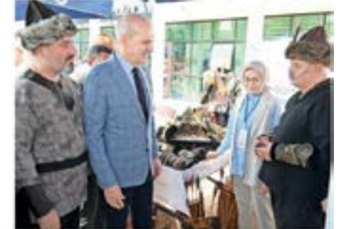
Meclis Başkanı Numan Kurtulmuş, ÖNDER Kurultayı kapsamında düzenlenen Uşak tanıtım stantlarını gezdi.

TBMM Başkanı Numan Kurtulmuş, ÖNDER'in 20. İmam Hatipliler Kurultayı'nda yaptığı konuşmada, aile yapısının güçlendirilmesinin temel hedeflerden olduğunu söyledi. Dünyada nesilleri mahvetmeyi kendisi için vazife bilen şer odaklarının büyük bir propagandayla hedef aldığı temel unsurlardan birisinin aile yapısı olduğunu vurgulayan Kurtulmuş "Bu aile yapısının güçlendirilmesi için bütün gücümüzle gayret edeceğiz ve inşallah önümüzdeki dönemde yapacağımız yeni anayasa çalışmasında da Türk ailesinin güçlendirilmesi ve korunması için gerekli adımları inşallah atacaktır" dedi.