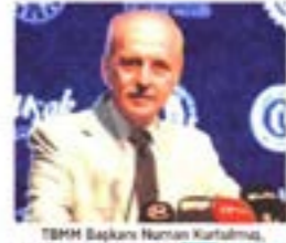
TBMM Başkanı Numan Kurtulmuş, Uşak'ta düzenlenen 20. İmam Hatipliler Kurultayı'na katıldı.

TBMM Başkanı Numan Kurtulmuş, Uşak'ta düzenlenen 20. İmam Hatipliler Kurultayı'na katıldı. Kurultayda konuşan Kurtulmuş, "Nitelikli bir gelecek ancak nitelikli insanlarla mümkündür. Onun için temel meselenin nitelikli insanları yetiştirmek, her alanda başarılı, güdü, bilgi, bilgin ve iftiharlı donatılmış, ferasetli, iyakatl ve akıllı, medeniyet değerleriyle donatılmış gençlerimizi yetiştirmek" dedi.