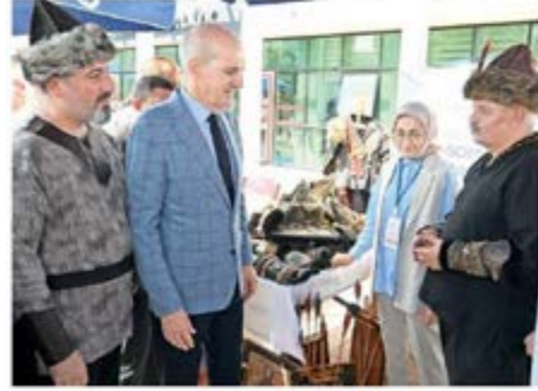
Meclis Başkanı Numan Kurtulmuş, ÖNDER Kurultayı kapsamında düzenlenen Uşak tanıtım stantlarını gezdi.

TBMM Başkanı Numan Kurtulmuş, ÖNDER'in 20. İmam Hatipliler Kurultayı'nda yaptığı konuşmada, aile yapısının güçlendirilmesinin temel hedeflerden olduğunu söyledi. Dünyada nesilleri mahvetmeyi kendisi için vazife bilen şer odaklarının büyük bir propagandayla hedef aldığı temel unsurlardan birisinin aile yapısı olduğunu vurgulayan Kurtulmuş "Bu aile yapısının güçlendirilmesi için bütün gücümüzle gayret edeceğiz ve inşallah önümüzdeki dönemde yapacağımız yeni anayasa çalışmasında da Türk ailesinin güçlendirilmesi ve korunması için gerekli adımları inşallah atacaktır" dedi.