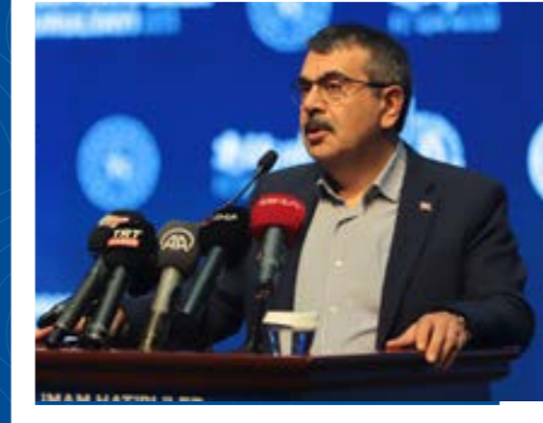
Yusuf Tekin Millî Eğitim Bakanı

K ıymetli Valim, Milletvekillerimiz, Belediye Başkanımız, Rektörümüz, Ağabeylerim, İmam Hatip Davasına Gönül Vermiş Kıymetli Dostlar, hepinizi en kalbi muhabbetlerimle selamlıyorum. Saygılar sunuyorum sizlere.