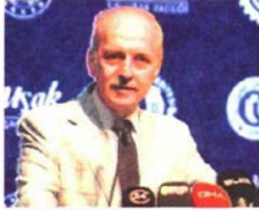
TBMM Başkanı Numan Kurtulmuş, Uşak'ta düzenlenen 20. İmam Hatipliler Kurultayı'na katıldı.

TBMM Başkanı Numan Kurtulmuş, Uşak'ta düzenlenen 20. İmam Hatipliler Kurultayı'na katıldı. Kurultayda konuşan Kurtulmuş, "Nitelikli bir gelecek ancak nitelikli insanların sırtında yükselir. Onun için temel meselemizin nitelikli insanlar yetiştirmek, her alanda başarılı, güçlü, bilgi, hikmet ve irfanla donatılmış, ferasetli, liyakatli ve ehliyetli, medeniyet değerleriyle donanmış gençlerimizi yetiştirmektir" dedi. Kurtulmuş, "Türkiye'nin demokrasi tarihinin seyrine paralel bir seyir İmam Hatip okullarının geçmişinde yer almıştır. Demokratik ortamın da kısıtlandığı, millet iradesinin baskı altına alındığı dönemlerde İmam Hatip liselerinin programları değiştirilmiş, kapısına kilit vurulmuştur. Öğrenci sayısının 60 binlere düştüğü günleri hatırlıyorum. Bugün 1.5 milyona yaklaşan öğrenci ordusuyla İmam Hatip liseleri aynı zamanda bir başarı öyküsüdür. Bizden önceki nesiller yokluk, kitlik, yoksunluk ve maalesef baskı altında