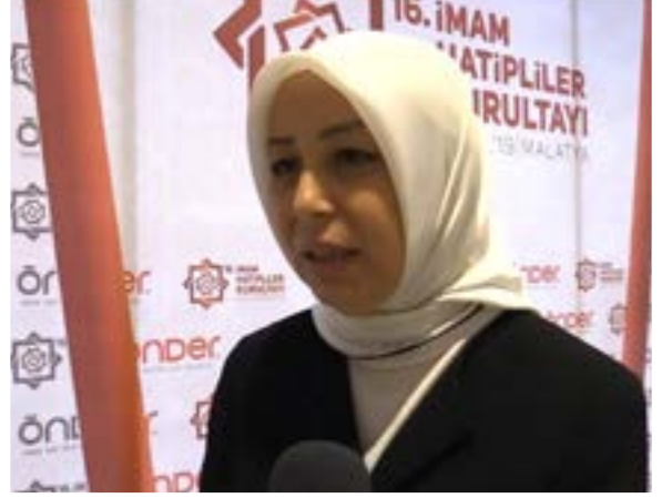
Özner ÇALIK AK Parti Genel Başkan Yardımcısı

Ben bütün imam hatipli kardeşlerimizin 16. Kurultay'da Malatya'da olmalarından çok büyük memnuniyet duyuyorum. Burada yaklaşık bin 500'e yakın farklı şehirlerden gelen kardeşlerimiz var. ÖNDER çatısı altında, ÖNDER çınarı altında gölgelenen bütün kardeşlerime Malatya'mıza hoşgeldiniz diyorum. Yolumuz daha çok uzun yeni başladık. Bu başlangıçla birlikte binaların içini, ruhunu dolduracak kıymetli ÖNDER'li, imam hatipli, o ruhu verecek olan bütün kardeşlerime can-ı gönülden teşekkür ediyorum. 16. Kurultayın hayırlı olmasını, 17. Kurultay'a da sağlıklı sıhhatle kavuşulmasını Rabbimden temenni ediyorum.