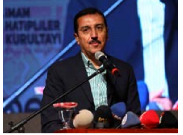
Bülent TÜFENKÇİ Gümrük ve Ticaret Eski Bakanı Malatya Milletvekili

Ç ok Değerli Bakanım, Çok Değerli Milletvekillerimiz, Çok Değerli Bilal Bey, Valimiz, Çok Değerli Misafirlerimiz, Bakan Yardımcımız, Gençler, hepinize hoşgeldiniz sefalar getirdiniz diyorum. Gerçekten Malatya'da böyle bir kurultayın yapılmasından dolayı onur duyuyoruz, sizleri Malatya'da ağırlamaktan dolayı şeref duyuyoruz. İnşallah rabbim kurultayımızı hayırlara vesile eder. İnşallah hayırlı sonuçlar elde ederiz ve 17. Kurultay'da buluşmayı Cenabı Allah bizlere nasip eder. Fırsat bulursanız Malatya'yı gezin, tanıyın. Malatya'nın güzellikleriyle güzel insanlarıyla tanışın. Hocam biraz önce bahsetti tahkiki eğitimden, Malatya buna hazır. Taklit çok yapmaz. Onun için Malatya'nın insanlarıyla konuşun, tartışın ve güzel neticeleri inşallah buradan götürün diyorum. Hepsiniz hoşgeldiniz, sefalar getirdiniz. Allah'a emanet olun.