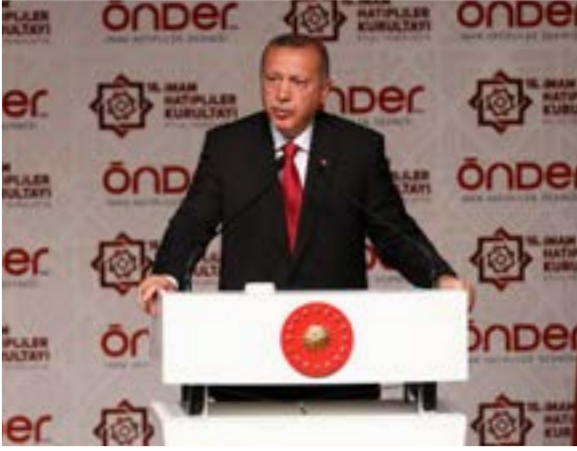
Recep Tayyip ERDOĞAN Cumhurbaşkanı

S evgili Malatyalılar, ÖNDER'in kıymetli yöneticileri, imam hatip camiasının çok değerli mensupları, saygıdeğer hocalarım, sevgili genç kardeşlerim sizleri selamların en güzeliyle hürmetle muhabbetle selamlıyorum. Allah'ın selamı, rahmeti, bereketi hepimizin üzerine olsun. Buradan ülkemizin dörtbir yanındaki imam hatipli kardeşlerime selam ve sevgilerimi gönderiyorum. İmam hatipliler kurultayı vesilesiyle bugün bir kez daha imam hatip nesliyle imam hatipli dostlarla biraraya gelmenin bahtiyarlığı içindeyim. Bu sene 16.'sı düzenlenen İmam Hatipliler Kurultayı'nın özellikle başarılarla dolu olmasını Allah'tan temenni ediyorum. Değerli Kardeşlerim, kurultaya davetleri için bu güzel atmosferde gönüllerimizi buluşturdukları imam hatipliler derneğimiz ÖNDER'e şahsım ve milletimiz adına şükranlarımı sunuyorum. Bu vesileyle imam hatip okullarının temelini atanlar başta olmak üzere on yıllardır bu okulların kuruluşunda, gelişmesinde, sayılarının artmasında emeği olan vakıf insanlarımıza ülkem ve milletim adına teşekkür ediyorum. Okullarımızda görev yapmış olup da ahirete irtihal etmiş tüm öğretmenlerimizi, yöneticilerimizi fedakarlıklarıyla destekleriyle bu müesseseleri yaşatan bütün hayırseverlerimizi rahmetle anıyorum.