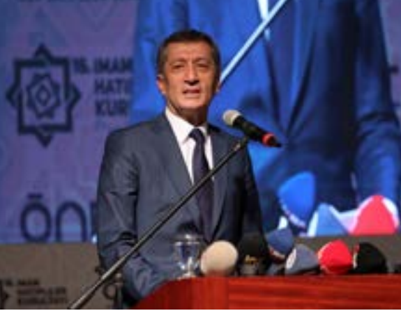
Prof. Dr. Ziya SELÇUK Milli Eğitim Bakanı

S elamun Aleyküm, Cümleten Merhaba. Bugün burada bu videoları izlerken ve yüz yıldan fazla bir geçmişi yad ederken 28 Şubat döneminde de üniversitede olan birisi olarak bu manada da neyin yaşandığını, ne tür sıkıntıların yaşandığını, ne cefaların yaşandığını bilen birisi olarak çok daha farklı hatıralar zinciri zihnimde canlandı. Sayın Valimiz, Sayın Vekillerimiz, Sayın Rektörümüz, Başkanlarımız, hepimiz burada bu güzelliği beraber yaşamak üzere bulunuyoruz. Ve giderek daha fazla umut vadeden, giderek çok daha fazla yeni bir yolu açmayı bize hissettiren birtakım hadiseleri de hep beraber yaşıyoruz.