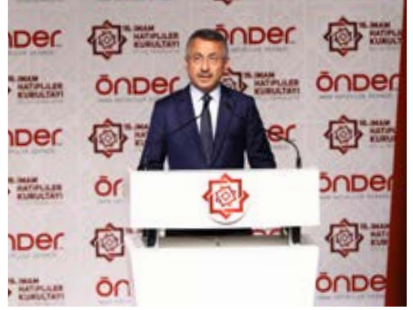
Fuat OKTAY Cumhurbaşkanı Yardımcısı

Yine liderliğinizde, önderliğinizde, başkanlığınızda tüm Türkiye olarak, gençlik olarak ama 16. yılını kutlayan kurultayımız olarak da hem ehliyet, hem liyakat hem de var mısınız dendiğinde sağına ve soluna bakmadan varım diyen bir camia olarak huzurlarınızda olacağız inşallah. Tekrar hayırlı olmasını diliyorum 16. yılın, saygılarımı ve hürmetlerimi arz ediyorum.