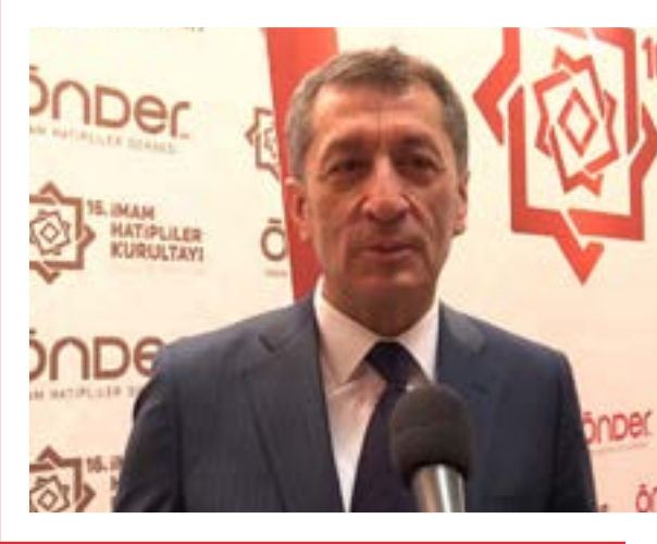
Prof. Dr. Ziya SELÇUK Milli Eğitim Bakanı