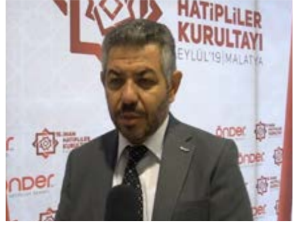
Kamber ÇAL ÖNDER Genel Başkanı

Tam eğitim dönemi başındayız. Bütün çalışmalarımızı bir sinerji oluşturan bir yaklaşımla tüm Türkiye'ye yayıyoruz. Bu çalışmaların her yıl çok sağlıklı şekilde derneklerimiz tarafından uygulandığını ve derneklerimize çok ciddi motivasyon sağladığını görüyoruz. İnşallah bu kurultayımızdan da aynı şekilde sağlıklı ve verimli bir sonuç elde edilecektir.