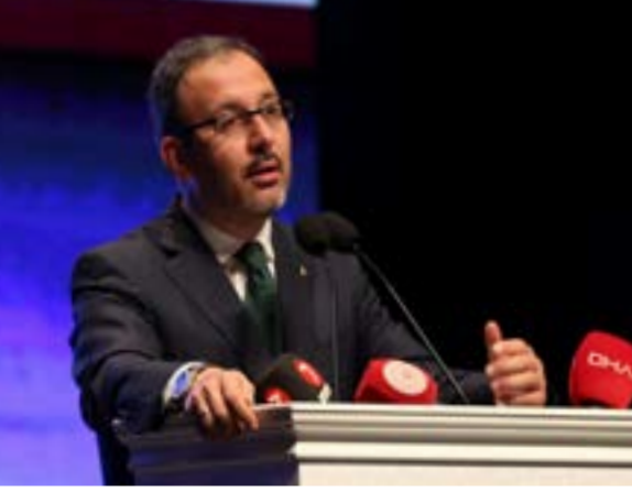
Dr. Mehmet Muharrem KASAPOĞLU Gençlik Ve Spor Bakanı

Ç ok Değerli ÖNDER Genel Başkanı, Muhterem Belediye Başkanı, Değerli Hazirun, Sevgili Gençler, ÖNDER Camiasının Kıymetli Mensupları; hepinizi en içten duygularıyla, hürmetle, muhabbetle selamlıyorum.