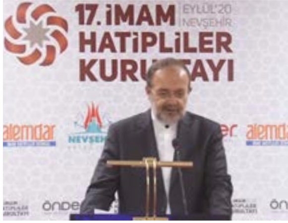
Prof. Dr. Mehmet GÖRMEZ İslam Düşünce Enstitüsü Başkanı

E sselamu Aleyküm ve Rahmetullahi ve Berakatühü. Bismillahirrahmanirrahim.