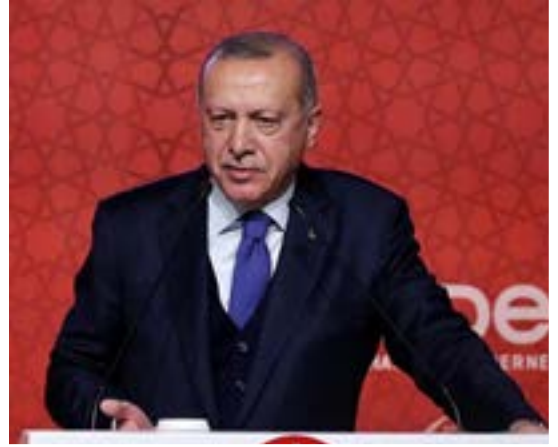
Recep Tayyip ERDOĞAN Cumhurbaşkanı

Milli ve manevi değerlere sahip nesiller yetişmesi için 1958 yılından beri büyük bir özveriyle faaliyet gösteren ÖNDER İmam Hatipliler Derneği, medeniyet davamızın lokomotif kuruluşlarından biridir. Bilhassa imam hatip okullarına yönelik ilginin arttığı dönemde ÖNDER'in çabaları çok büyük önem kazanmıştır. İmam hatip okulları bir eğitim kurumu olmanın çok ötesinde ülkemize istikamet çizen, ufkumuzu aydınlatan, aziz milletimizin değerlerine canı pahasına sahip çıkan gençlerin yetiştiği kutlu çatılardır. Milletimiz; kuruluşundan itibaren eline geçen her fırsatta bu okullara destek olmuş, imam hatipleri adeta küllerinden yeniden inşa etmiştir. Darbeciler tarafından kapisına kilit vurulmak istenen imam hatipler, bu ülkeye cumhurbaşkanı, başbakan, bakan, milletvekili belediye başkanı, bürokrat yetiştiren seçkin eğitim kurumları haline dönüşmüştür. Bütün aşağılamalara, bütün hakaretlere, baskılara, yasaqlara rağmen hamdolsun imam hatip okulları dimdik ayaktadır.