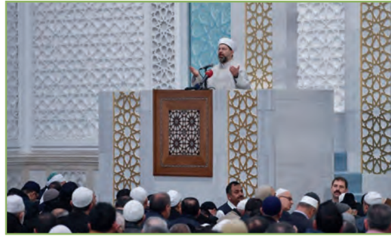
ÖNDER Ankara Temsilçiliğimiz, Diyanet İşleri Başkanı Sayın Prof. Dr. Ali Erbaş, Dünya Olimpiyat Şampiyonu Taha Akgül ve ailecek sabah namazı kılmaya gelen 5000 kişinin katılımıyla Ankara Ahmet Hamdi Akseki Camii'nde sabah namazı programı düzenledi.