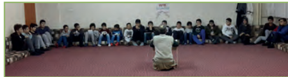
Maltepe İmam Hatip Mezunları ve Mensupları Derneği MİHMED, gençlere sahabelerimizin hayatını öğretmek ve kişisel gelişim alanında bilgi ve birikim kazanabilmeleri için her hafta dernek merkezinde alanında uzman kişileri öğrencilerle buluşturuyor.