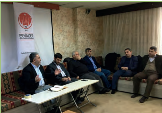
ESENİMDER , düzenlediği genel kurul sonrası yönetim kurulu üyeleriyle istişare toplantısı düzenledi.