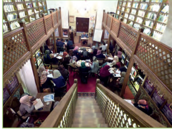
Kütahya'daki 600 yıllık bir geçmişe sahip olan Şeyh Muslihiddin Tekkesi, gençlerin kitaplarını okurken güzel bir sohbet eşliğinde kahve çaylarını yudumlayabilecekleri kütüphaneye çevrildi.