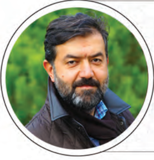
Halit BEKİROĞLU ÖNDER Genel Başkanı