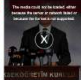
YÖK Başkanı Özkant Profesör mesajlarında tezvirik herşey 10 bin lirasay

21 Eylül 2022 - 00:00 | Gündem | İNTERNETLEME 21 Eylül 2022 - 00:00