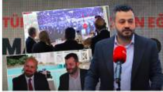
İmam Hatiplerin 109 yıllık raporu açıklandı

Aktarıldı | 10 Eylül 2022, 10:04 | Son Güncelleme: 10 Eylül 2022, 10:04 | Her Şeyi